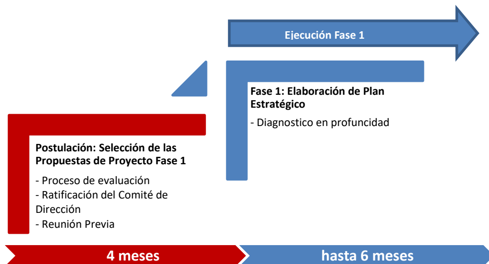
Figura 1: Flujo de la fase 1 del concurso CET

Las entidades que cuenten con planes estratégicos culminados en la fase 1, podrán presentarse al concurso de la fase 2. Así mismo, podrán participar las entidades que cuenten con un plan estratégico y que no hayan recibido cofinanciamiento de Innóvate Perú en la fase 1.