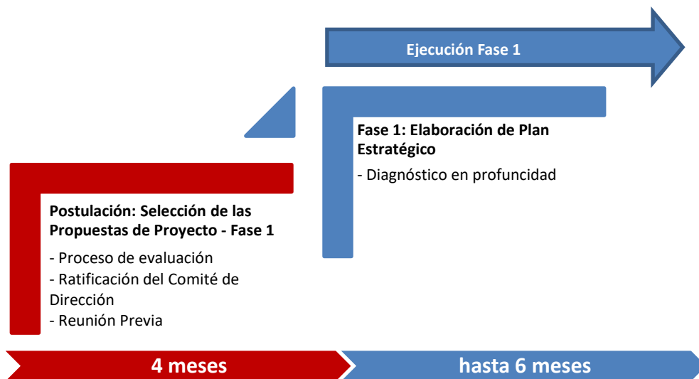
Figura 1: Flujo de la Fase 1 del concurso CET

Las entidades que cuenten con Planes estratégicos culminados en la Fase 1, podrán presentarse al concurso de la Fase 2. Asimismo, podrán participar las entidades que cuenten con un Plan Estratégico y que no hayan recibido cofinanciamiento de Innóvate Perú en la Fase 1.